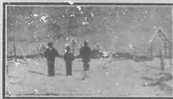
Cementerio de una aldea rusa

pa una extensión de algunos kilómetros. En él figuran portaestandartes con enormes y caprichosas banderas, músicos que soplan en gigantesas trompetas, los hijos del difunto vestido de blanco, deteniéndose para saludar á los amigos é interrumpiendo sus sollozos con sonrisas á los conocidos. Después sigue el catafalco, sostenido por cabañas ó cien porteadores, y á continuación criados conduciendo la sombrilla del difunto, su silla de marcos, su abanico y á veces figuras de papel de tamaño natural representando los criados y los animales domésticos que pertenecieron al difunto, todo lo cual ha de quemarse sobre su sepultura.