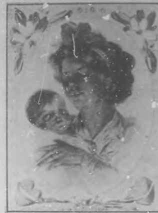
"Esta es la única alegría del amor...."

Mi amada me quiere tanto, que hasta su terquedad, sus desvíos, y sus sobrecijos tienen para ella gracia y favor.