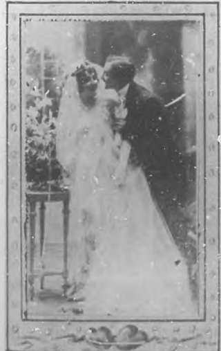
"El amor verdadero no machita el azahar del alma...."

Forman estas citas un ramillete fragante y lindo: "Tu, Julia, me has metamorfoseado; me haces desatender mis estudios, perder el tiempo, oponerme á consejos buenos, desafiar el mundo; y has debilitado mi juicio, me has dejado ensimismado.