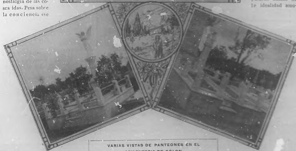
VARIAS VISTAS DE PANTEONES EN EL CEMENTERIO DE COLON

en la obra humana. El instinto de las razas está palpitando hasta en las mentudencias de nuestros actos. Dar ideas es dar algo de nuestra vida espiritual. Por esto en las flores que dejamos en los sepulcros damos de la idealidad amo-