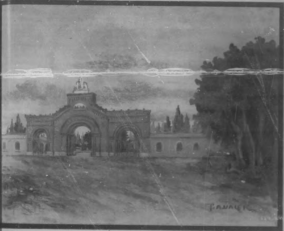
Cementerio de Colón.—Dibujo de Pedro A. Valer.