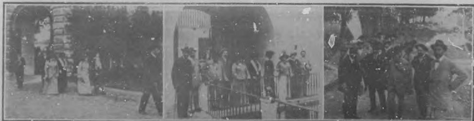
El General José Miguel Gómez en Sevilla.—Una visita al Alcázar.—En una de las terrazas del palacio.—El General con un grupo de amigos en el Alcázar.