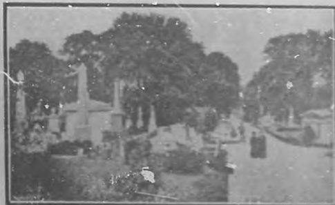
Cementerio de Kensal Green, en Londres.