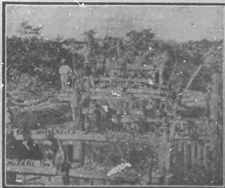
Un cementerio en Madagascar

En Corcega colocan al muerto en una mesa, la rodean los amigos y parientes; la "voceratrice" entona la canción de las buenas obras del difunto; de noche llevan al muerto en un caballo envuelto en un capote, y sostenido en la silla, por medio de cuerdas y horquillas de madera. Un cortejo fúnebre presidido por uno de estos macabros jinetes, es de lo más fantástico por no decir de lo más terrorífico que puede imaginarse. — Z. y R.