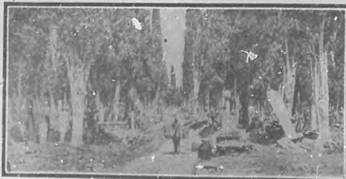
El cementerio de Constantinopla

Son curiosas también varias costumbres de enterrar á los muertos. En Rusia el cadáver es conducido en un trineo de la propiedad del muerto. En Spreewald, la Venecia de Alemania, cuando muere el jefe de la