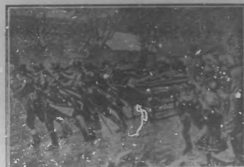
Sobre pacinos en el Spreewald

los ojos del muerto. En Madagascar se les envuelve en un lienzo cuyo importe costean los amigos del difunto, y el velorio es una vacanal. Entre los indios de la América del Sur y de Méjico existe la costumbre del velorio, que consiste en celebrar una juerga con guitareo y baile en presencia del difunto. Los australianos envuelven al muerto en un llo de hojas y hierbas como si fuera un tallo y lo echan al hoyo con sus armas.