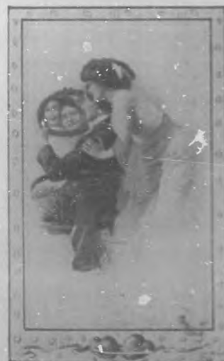
"Como un espejo ves tu corazón...."

El amor no se abita.... Es todo verdad.—J. C. Siles.