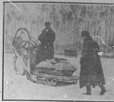
En San Petersburg: entierro de una víctima de las matanzas. (De 'Illustration').

Los argelinos son aficionados á visitar los cementerios. Son el punto de cita de las mujeres para charlar allí entre las tumbas, y los viejos se sientan sobre los túmulos. En Turquía hay esta misma costumbre. En el cementerio de Constan-