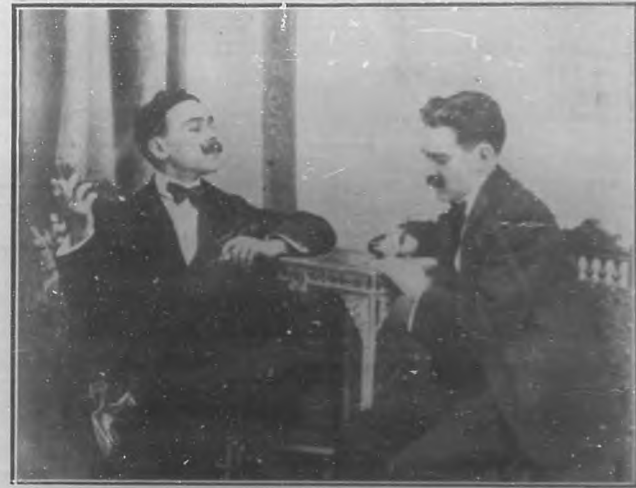
... La isla es siempre físicamente substantiva, se demarca con preciso relieve, legándose sobre la basta extensión del mar. ...

Curiosidad del reporter. — El sujeto es el agente de la prensa. — Sentación. — Rasgo principal de mi carácter. — La naturalidad en un acto de ser de las personas. — Realidad substantiva de la isla, comparada con otras porciones del globo. — Caracter del isleño. — Cuestión de razas. — Opinión acerca del periodismo. — Cultura e intuición. — Diferencia entre el periodista y el hombre sabio, y otras cosas más que verá el lector.