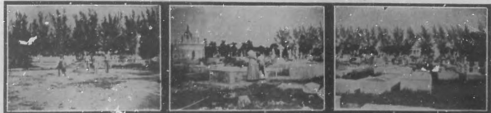
EN EL CEMENTERIO DE COLON.—Arreglando los sepulcros. Colocando flores. Grupo de tumbas

guisa lo que queremos. Los nuestros viven con nosotros. Y viven allí, y á donde están, vamos á buscarlos. Y vamos con las dos cosas más puras de la tierra, con flores y con lágrimas. No sé si todos llevarán plegarias místicas. Para esto, para amortiguar una expiación se necesita que estemos convencidos de la culpa. La religión