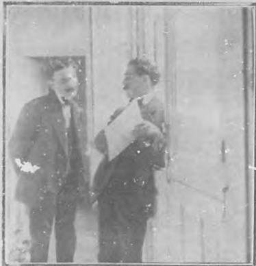
—Ve usted este árbol genealógico? Por el resultado yo descendiente de la princesa Tequise.

sin que las propiedades físicas de esos lugares, divididos por sistemas políticos, se diferencien marcadamente: sólo en la