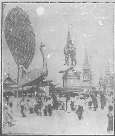
El Cementerio en Birmania

Hacen lo mismo que los chinos los indios de la América del Norte, es decir, no los entierran, sino los envuelven en una piel gruesa y los colocan en lugares estériles donde no llueve, hasta que el viento los hace polvo.