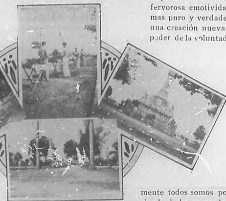
EN EL CEMENTERIO DE COLON.—De izquierda á derecha: Monumento de los Condes de la Mortera. Vendedores de flores. Monumento de los Bomberos. Paseo de los cauchos.

idealidad de lo que vuela hacia el infinito. Admitimos lo espiritual del misterio; forzosemente lo amamos, porque en esa somnolencia de la imaginación en que vivimos vagamos en un delirio de ideas, en un reino de zozobras tendientes á la quietud en cualquier forma. Y la muerte, es una forma de la quietud, es la realidad del misterio de las cosas—de que habla Brunetiere.—Para el misterio tenemos las flores del pensamiento, las rosas del deseo. Libamos en ese perpetuo delirio una intensa dulcedumbre, para arrojarla á la ceniza de las ilusiones. La muerte es una forma radiante de la vida, ha dicho un místico, y es una verdad. Por esto la vida como la muerte tiene piedades, como tiene