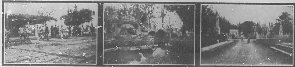
EN EL CEMENTERIO DE COLON.—Vendedor de flores en la puerta del cementerio. Camino del sepulcro. Vista de un paseo del cementerio.

La fecha dedicada al recuerdo de los muertos tiene si bien se examina la alegría de la emoción, y es porque hay en ella una evocación: se revive lo que hemos amado. Muy humana