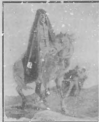
Un entierro en Corcega. — El cadáver erguido sujeto al caballo.

En China los entierros revisten excepcional lujo. En tanto que llega el momento de partir el entierro de la casa mortuoria, todo es en ésta risa y alegría, hasta que el pariente más próximo del finado entra y dice: "Ha llegado la hora de llorar". Llora todo el mundo á moco y baba, y luego á la vez de "Basta", vuelven todos á reír y á charlar como si nada hubiese ocurrido. Entonces se coloca el ataúd sobre un catafalco portátil cubierto de soberbias telas bordadas y se pone en marcha el cortejo, que á veces ocu-