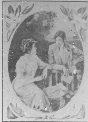
"El amor es la luz de los cielos...."

El amor es la encarnación de la idealidad y el poeta su predicador. El más grande y estimable de los tres es el amor. Es la pasión celestial que atrae al hombre á lo bueno. En palabras del poeta inglés, Byron: