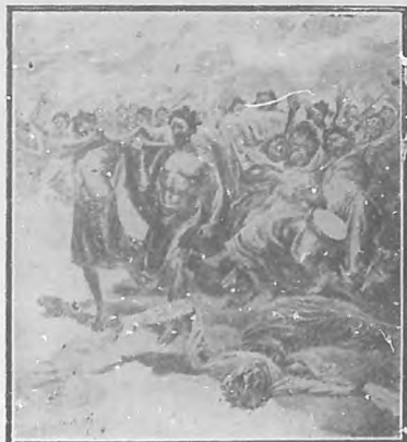
En Madagascar. De un dibujo de Mad. Paule Crampel.